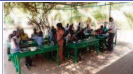
Les élèves de la 4ème promotion

Nous sommes persuadés que par cette stratégie l'agro-écologie s'ancrera dans les terroirs en commençant au niveau communal, car des maires de communes voisines ont manifesté leur intérêt pour cette démarche, puis s'élargira au niveau régional.