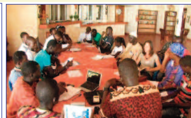
Atelier sur la gestion de l'eau