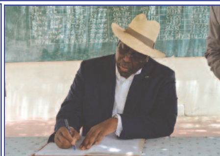
Signature du Livre d'or de Jardins d'Afrique par

Au mois de Juillet, Son Excellence Monsieur Macky SALL, Président de la République du Sénégal, nous a fait l'honneur de sa visite à Kaydara, puis ce fut Monsieur Moustapha NIASSE, Président de l'Assemblée Nationale, et au fil des mois, de nombreux autres événements ont marqué l'année qui se termine, tels que les rencontres qui se sont déroulées avant la COP21 concernant l'agro-écologie. Nous avons choisi de faire un retour en arrière et de relater les faits les plus importants.